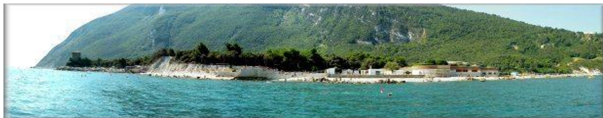
una veduta dal mare di Portonovo

Navigheremo dal porticciolo di Numana verso Sirolo e i Sassi Neri fino agli scogli delle Due Sorelle , successivamente arriveremo a Portonovo , dove sarà possibile tuffarsi per un bagno. Il rientro è previsto per le ore 21 circa.